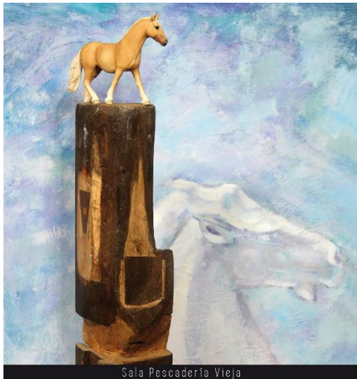
Sala Pescadería Vieja

Works exhibited in the Sala Pescadería Vieja From September 3 to October 14, 2018